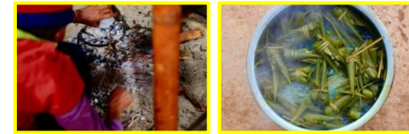
ทำขนมพื้นบ้าน