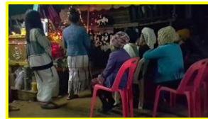
เครื่องดนตรี